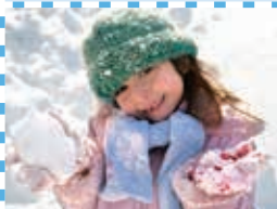
Build a Fort